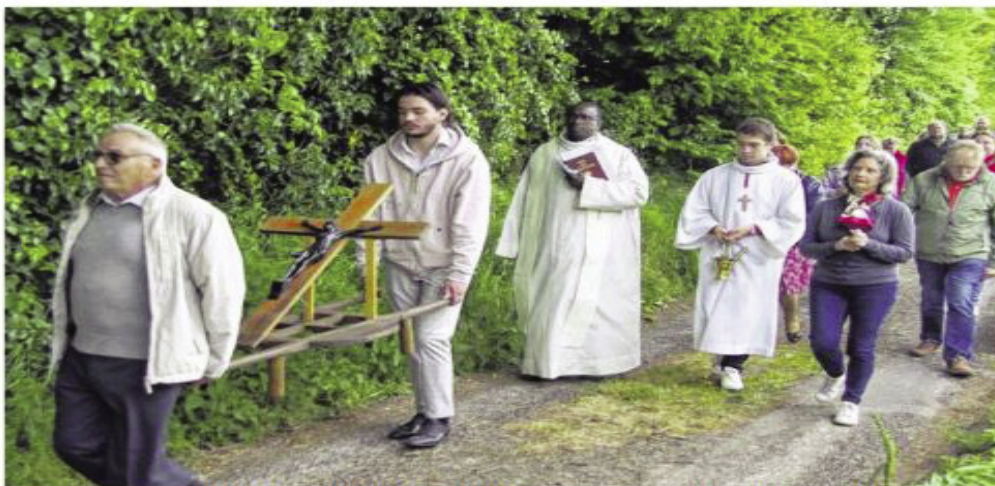
La statue, placée sur un brancard ancien, a parcouru en procession les petits chemins de Fouqueville.